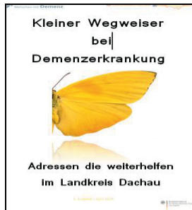
1. Ausgabe Juni 2015