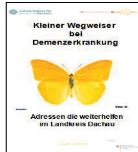
2. Ausgabe August 2016