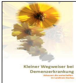
4. Ausgabe Juni 2021