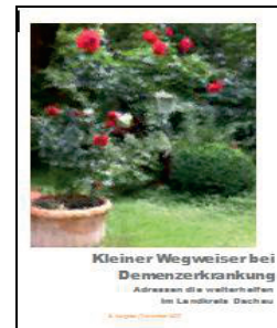
3. Ausgabe Dezember 2017