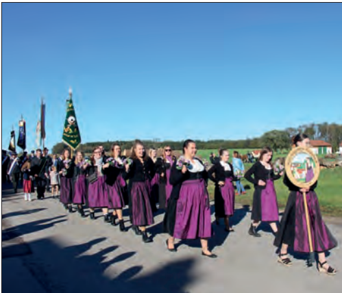
Pasenbacher Kirche St. Leonhard und Anna.