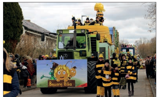
Die Bienen vom Bauwong Pelka.