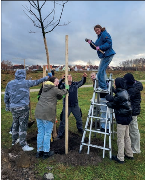
Jugendliche beim Bäume pflanzen.