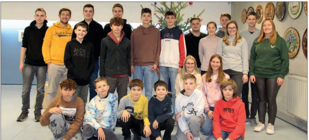
Die Jugend des Schützenvereins.