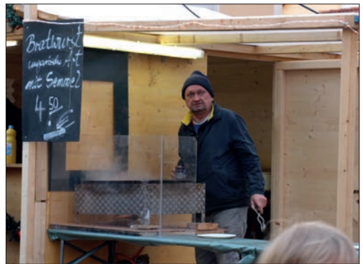
2. Bürgermeister beim Würstl grillen.