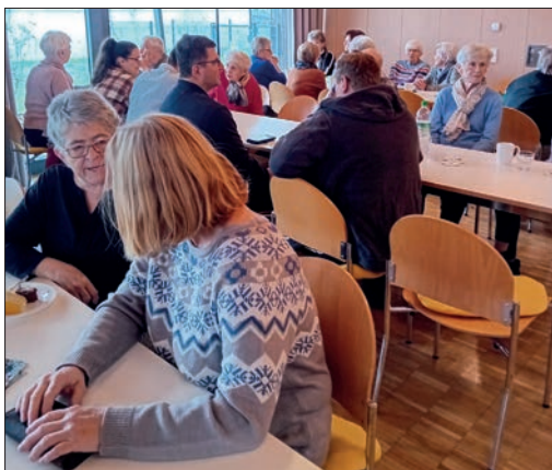
Besucher beim Adventsbasar.