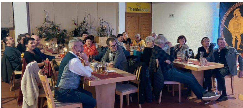
Versammlung beim Gewerbeverein.