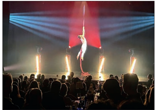
Siegerehrung von Talents 2022 im GOP (27.09.2022).