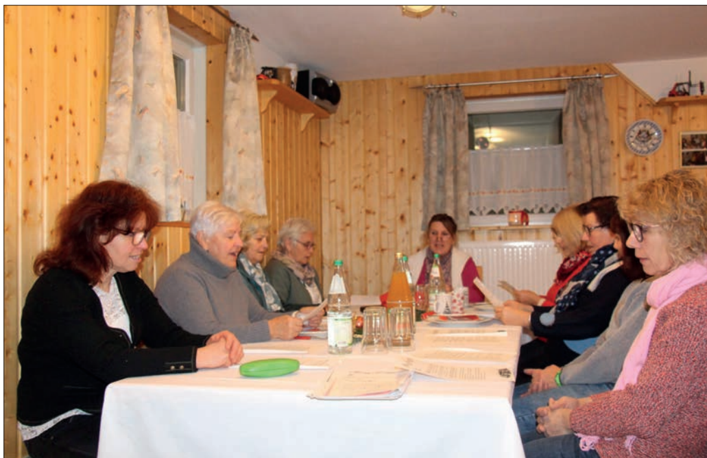
Landfrauen beim gemeinsamen Singen.