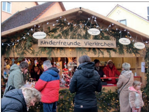
Standl der Kinderfreunde.

Vereine dazu. So war der Frühschoppenstammtisch wieder fleißig mit Holzarbeiten und hat vom Puppenbett bis zur Weihnachtsdeko vieles angeboten. Im Stoanastandl können die Besucher vom Amethyst bis zum Stoanadrachen alles kaufen. Auch die Vereinigung für Kultur und Brauchtum, die Wanderfreunde oder die Kinderfreunde boten viele weihnachtliche Artikel an. Zugunsten der Sternstunden war ebenfalls ein Stand aufgebaut. Belagert war zwei Tage lang auch die Losbude des Aktionskreises wo man von Weihnachtskugeln, Lichterket-