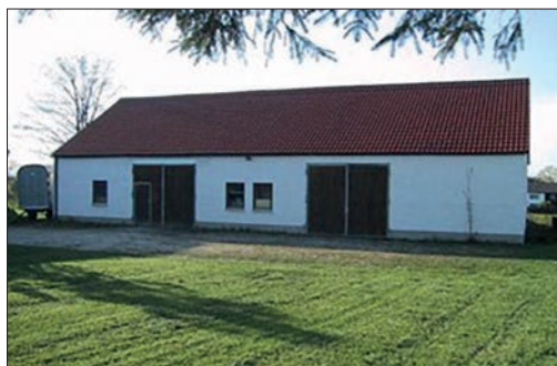
Vierkirchner Vereinshalle am Musikheim.

Nach mehreren kontroversen Diskussionen im Gemeinderat wurde im Jahr 1991 der Neubau des Feuerwehrhauses am selben Standort beschlossen. Als Zwischenquartier diente der Feuerwehr Vierkirchen bis zur Fertigstellung die im Jahr 1992 fertiggestellte Vierkirchner Vereinshalle hinter dem Rathaus. Danach sollte diese Halle für die verschiedenen Ortsvereine als Lagerraum zur Verfügung stehen. Das Gebäude wurde überwiegend durch Eigenleistung aller Vereine errichtet.