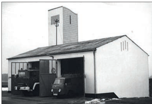
Feuerwehrgerätehaus von 1966 an der Dachauer Straße.

Am 07.11.1993 war es schließlich so weit. Nach ca. 15 Monaten Bauzeit und über 2.000 Stunden Eigenleistung neben dem "normalen" Feuerwehrdienst wurde das neue Gerätehaus eingeweiht und seiner Bestimmung übergeben. Sämtliche Räume und Einrichtungen wurden der Bevölkerung im Rahmen von Vorführungen präsentiert. Für die Kinder wurde ein Feuerwehrquiz mit Preisen und ein Ballonflugwettbewerb veranstaltet. Der Siegerballon wurde aus Tschechien an uns zurückgeschickt. Gemeinderat, Landkreispolitiker, Nachbarfeuerwehren und etwa 400 Vierkirchner Bürger feierten mit uns das lang ersehnte neue Feuer-