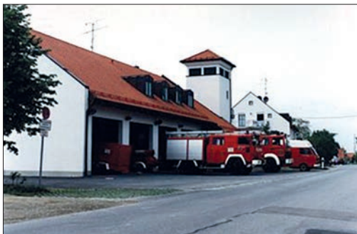
Das neue Gerätehaus im Jahr 1993 mit den damaligen Fahrzeugen.

Fahrzeugausrüstung (u.a. dem in 1993 neu beschafften LF 16/12) wurde von der Gemeinde Vierkirchen die Grundlage für eine effektive Arbeit der Feuerwehr geschaffen. Durch die deutlich verbesserten Bedingungen wird die Instandhaltung der Geräte erleichtert, das ge-