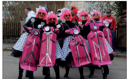
Die Vespa Women Biberbach.