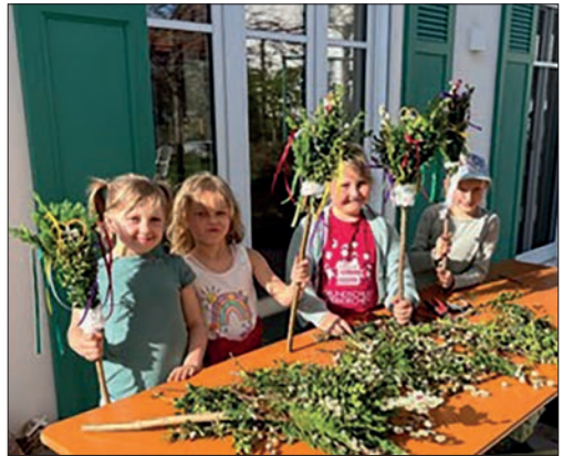
Die Kinder verbunden die Fürbitten und Farben der Bänder mit Jesugeschichten.