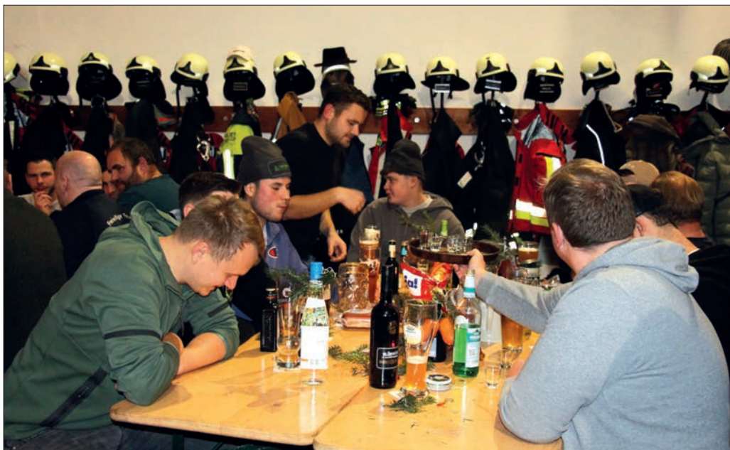
Die ersteigerte Ware wird gleich verköstigt.