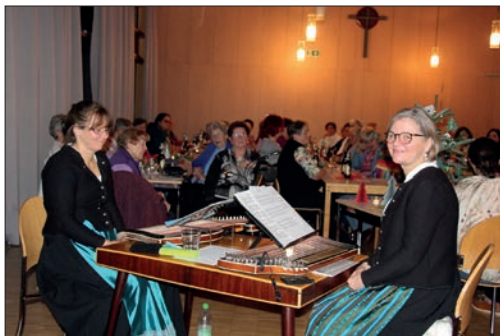
Musikalische Unterhaltung durch das Wintergarten-Duo.