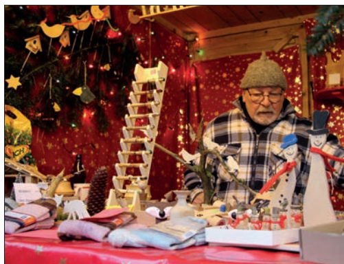
Holzarbeiten bei den Stammtischfreunden.

Beiträge für Vierkirchen Aktuell an: vierkirchenaktuell@offsetbetz.de