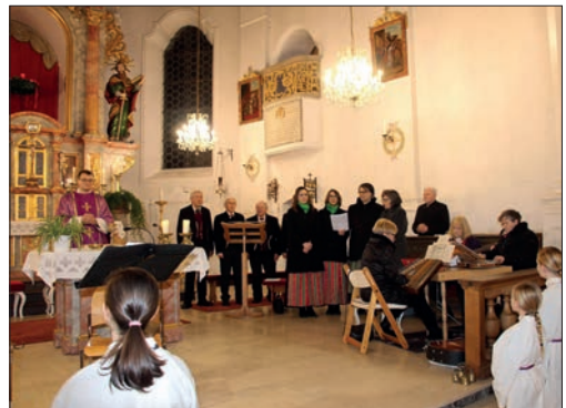
Musiker im Altarbereich beim Andachtsjodler.