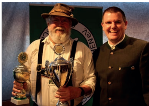
Viele glückliche Gesichter beim Vereineschießen im Jahr 2025 und viele interessierte Besucher.