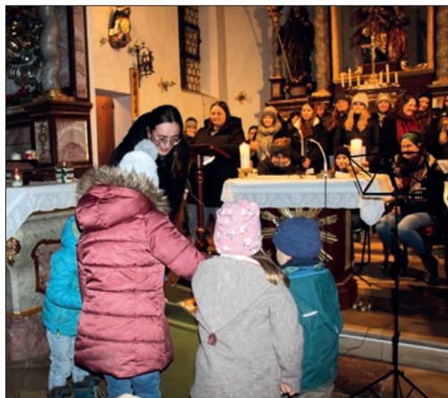
Kinder dürfen das Paket öffnen.