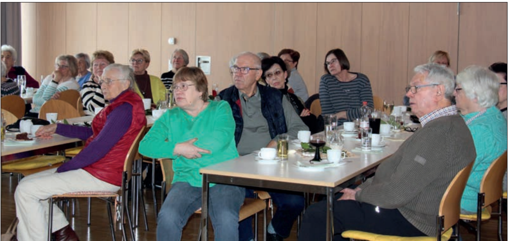
Interessierte Zuhörer im Kath. Pfarrsaal.