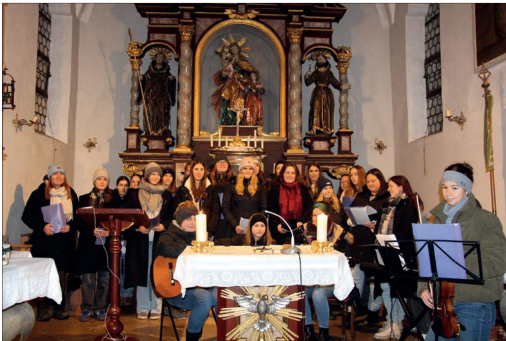
Mädchengruppe Pasenbach im Altarraum.