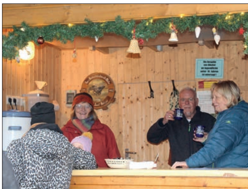
Probierschluck vom Glühwein.