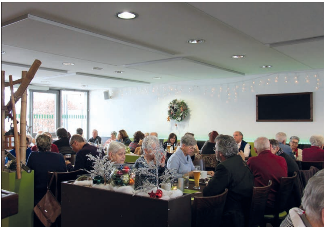
Voll besetztes Café Paso.